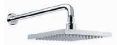
ref. 30 0375 04 Braccio doccia tondo con soffione quadro mm 200x200 Round shower arm with 200x200 mm square shower head Bras mural ronde avec pomme de douche carré 200x200 mm