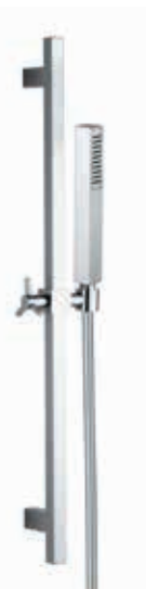
ref. 30 0391 00 Doccia saliscendi quadra Square sliding rail with square shower Barre carrée avec douche carrée