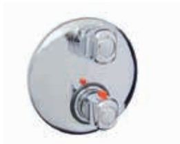
ref. 36 CR 0927 Miscelatore termostatico doccia incasso due uscite 2-way built-in thermostatic shower mixer Mitigeur thermostatique douche à encastrer, deux sorties

I miscelatori termostatici sono forniti completi di corpo incasso Thermostatic mixers are supplied with built-in bodies Les mitigeurs thermostatiques sont fournis complets avec les corps à encastrer