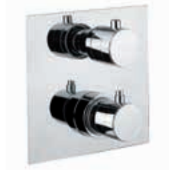
ref. 31 CR 0990 Miscelatore termostatico doccia incasso Built-in thermostatic shower mixer Mitigeur thermostatique douche à encastrer