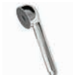
ref. 35 DOC0 15 Doccia Beta cromata Beta chrome shower Douche chromée Beta