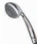
ref. 35 DOC0 17 Doccia Dolli idromassaggio Dolli massage shower Douche Dolli hydromassage