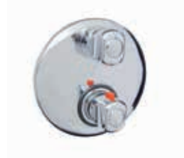
ref. 36 CR 0924 Miscelatore termostatico doccia incasso Built-in thermostatic shower mixer Mitigeur thermostatique douche à encastrer