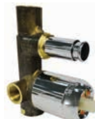
ref. 35 PAI0 02 Corpo miscelatore doccia incasso con deviatore due uscite 2-way built-in body for shower mixer with diverter Corps pour mitigeur douche à encastrer avec inverseur deux sorties

Informazioni tecniche su: Technical data sheet on: Renseignements techniques sur: