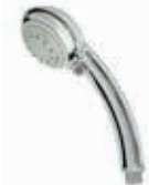
ref. 35 DOC0 16 Doccia Jessi idromassaggio Jessi massage shower Douche Jessi hydromassage