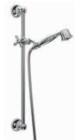
ref. 30 0394 00 Doccia saliscendi retro Sliding rail with old style shower Barre avec douche rétro