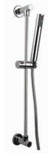
ref. 30 0397 00 Doccia saliscendi minimal Sliding rail with minimal shower Barre avec douche minimale