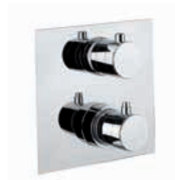
ref. 31 CR 0993 Miscelatore termostatico doccia incasso due uscite 2-way built-in thermostatic shower mixer Mitigeur thermostatique douche à encastrer, deux sorties