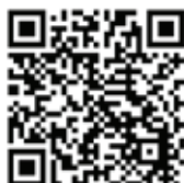
ref. 35 PAI0 12 Corpo miscelatore doccia incasso con deviatore due uscite con bilanciatore di pressione 2-way built-in body for shower mixer with diverter with pressure balance Corps pour mitigeur douche à encastrer avec inverseur deux sorties avec régulateur de pression