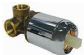
ref. 35 PAI0 01 Corpo miscelatore doccia incasso un'uscita 1-way built-in body for shower mixer Corps pour mitigeur douche à encastrer

Informazioni tecniche su: Technical data sheet on: Renseignements techniques sur: