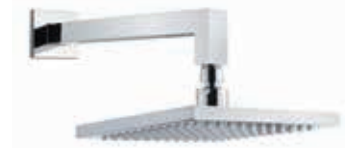
ref. 30 0375 00 Braccio doccia quadrato con soffione quadro mm 200x200 Square shower arm with 200x200 mm square shower head Bras mural carré avec pomme de douche carré 200x200 mm