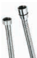
ref. 30 0370 15 Flessibile cm 150 150 cm flexible hose Flexible cm 150