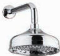
ref. 30 0377 00 Braccio doccia con soffione antico Shower arm with old style shower head Bras mural avec pomme de douche rétro