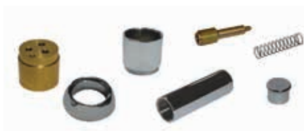
ref. 35 KIP0 10 Kit prolunga cromata per doccia incasso con deviatore Chrome extension kit for built-in shower mixer with diverter Kit rallonge chromé pour mitigeur douche à encastrer avec inverseur