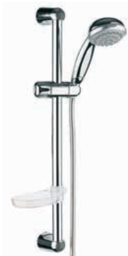
ref. 30 0395 00 Doccia saliscendi Idro Plus Idro Plus sliding rail Barre avec douche Idro Plus