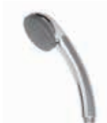
ref. 35 DOC0 18 Doccia Quarzo Quarzo shower Douche Quarzo