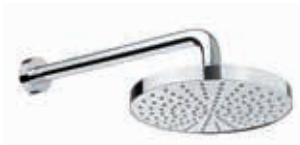
ref. 30 0373 00 Braccio doccia con soffione tondo mm 200 Shower arm with 200 mm round shower head Bras mural avec pomme de douche ronde mm 200