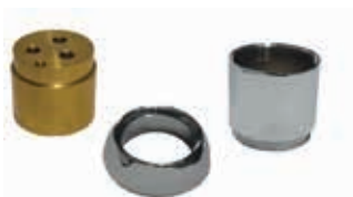
ref. 35 KIP0 01 Kit prolunga cromata per doccia incasso Chrome extension kit for built-in shower mixer Kit rallonge chromé pour mitigeur douche à encastrer