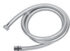
ref. 35 FLE0 08 Flessibile silver antitorsione cm 150 Silver anti-twist flexible hose, cm 150 Flexible silver cm 150