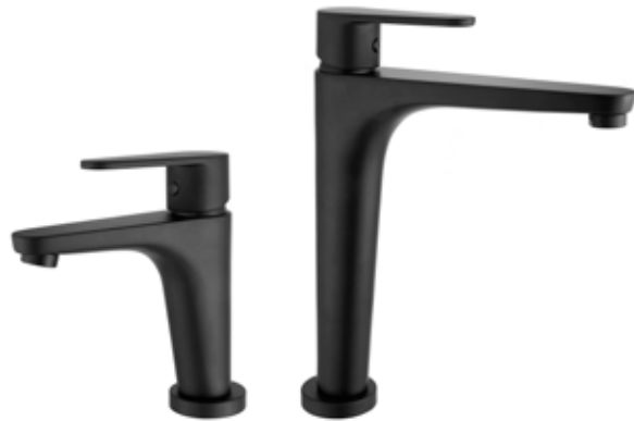
88NN5514 01 Miscelatore lavabo alto. One hole basin mixer, high body.

Articolo con scarico click clack in finitura colorata Item with click clack waste in colour finishings