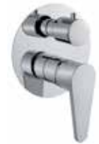
88CR7561 Miscelatore doccia incasso con deviatore, 3 vie. 3-way built-in shower mixer.

Accessori doccia in nero opaco a pag.63 / Mat black shower accessories on page 63