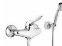
83CR5127 Miscelatore doccia esterno. External shower mixer.