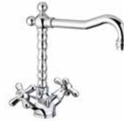
26CR0625 01 Monoforo lavabo. One hole basin mixer. 3/8" 26 CR 0625 01 = flex 3/8"F 1/2" 26 CR 0625 02 = flex 1/2"F