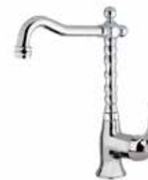
47CR5225 01 Miscelatore lavabo. One hole basin mixer. 3/8" 47 CR 5225 01 = flex 3/8"F 1/2" 47 CR 5225 02 = flex 1/2"F