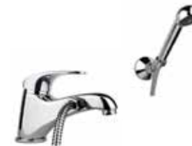
32CR1090 Miscelatore vasca con duplex. Bath mixer with shower set.