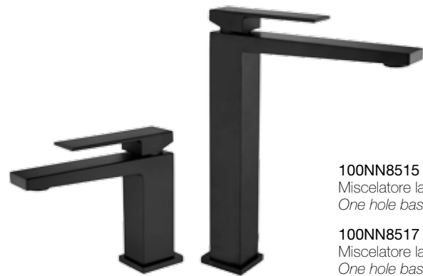
100NN8515 01 Miscelatore lavabo. One hole basin mixer.