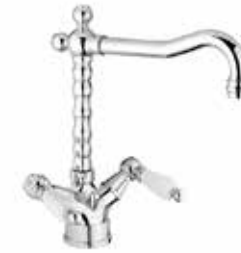
02CR0625 01 Monoforo lavabo. One hole basin mixer. 3/8" 02 CR 0625 01 = flex 3/8"F 1/2" 02 CR 0625 02 = flex 1/2"F