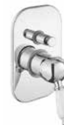
83CR5134 Miscelatore doccia incasso con deviatore, 2 vie. 2-way built-in shower mixer.