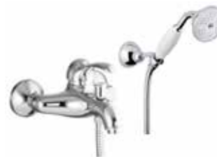
47CR5104 Miscelatore vasca con duplex. Bath mixer with shower set.