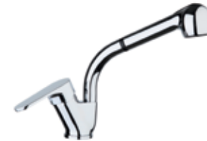
75CR4395 01 Miscelatore lavello, doccetta estraibile. One hole sink mixer, pull-out shower. 3/8" 75 CR 4395 01 = flex 3/8"F 1/2" 75 CR 4395 02 = flex 1/2"F