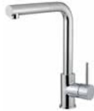
306CR9403 01 Miscelatore lavello, doccetta estraibile. One hole sink mixer, pull-out shower. 3/8" 306 CR 9403 01 = flex 3/8"F 1/2" 306 CR 9403 02 = flex 1/2"F