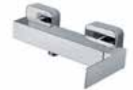
100CR8542 Miscelatore doccia esterno. External shower mixer.