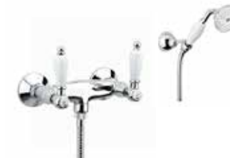
02CR0602 Gruppo doccia esterno. External shower mixer.