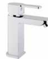
76CR7430 01 Miscelatore bidet. One hole bidet mixer. 3/8" 76 CR 7430 01 = flex 3/8"F 1/2" 76 CR 7430 02 = flex 1/2"F