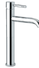
44CR5288 01 Miscelatore lavabo alto. One hole basin mixer, high body. 3/8 44 CR 5288 01 = flex 3/8"F 1/2 44 CR 5288 02 = flex 1/2"F