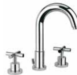
25CR0528 Batteria lavabo 3 fori. 3-hole basin mixer.