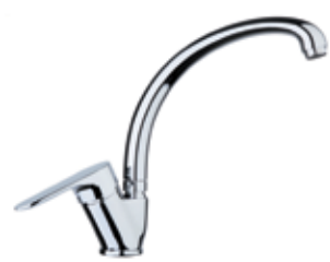
81CR4310 01 Miscelatore lavello. One hole sink mixer. 3/8" 81 CR 4310 01 = flex 3/8"F 1/2" 81 CR 4310 02 = flex 1/2"F