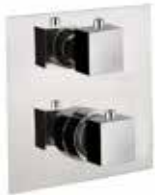
31CR0912 Miscelatore termostatico doccia incasso. Built-in thermostatic shower mixer.