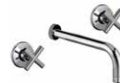
25CR0527 Miscelatore lavabo a muro. Wall basin mixer.