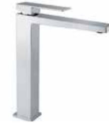
100CR8517 01 Miscelatore lavabo alto. One hole basin mixer, high body. 3/8" 100 CR 8517 01 = flex 3/8"F 1/2" 100 CR 8517 02 = flex 1/2"F