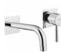
44CR5227 Miscelatore lavabo a muro. Wall basin mixer.