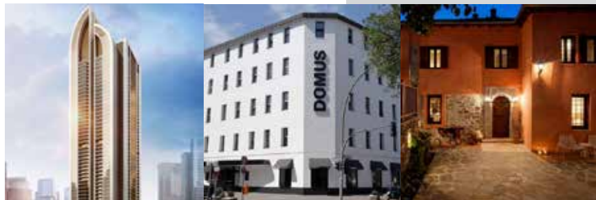
Al Duja Tower Dubai UAE