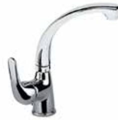
41CR4633 01 Miscelatore lavabo. One hole basin mixer. 3/8" 41 CR 4633 01 = flex 3/8"F 1/2" 41 CR 4633 02 = flex 1/2"F