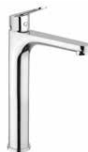
86CR8119 01 Miscelatore lavabo alto. One hole basin mixer, high body. 3/8" 86 CR 8119 01 = flex 3/8"F 1/2" 86 CR 8119 02 = flex 1/2"F