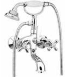
26CR0600 Gruppo vasca. Bath mixer.