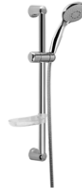
30 0395 00 Set saliscendi 62-25 con doccia Siro 3g. testa d.10 cm flex doppia aggraffatura portasapone trasparente. Sliding rail set 62-25 with 3-jet Siro shower Ø 10 cm, transparent soap dish.