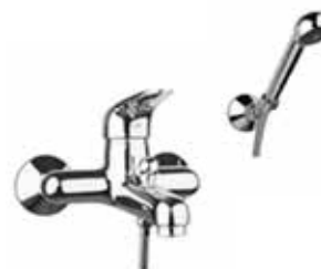
32CR1000 Miscelatore vasca con duplex. Bath mixer with shower set.

\frac{3}{8} 32 CR 3210 01 = flex 3/8" F \frac{1}{2} 32 CR 3210 02 = flex 1/2" F