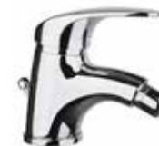
32CR3210 01 Miscelatore bidet. One hole bidet mixer.

\frac{3}{8} 32 CR 2243 01 = flex 3/8" F \frac{1}{2} 32 CR 2243 02 = flex 1/2" F