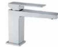
100CR8515 01 Miscelatore lavabo. One hole basin mixer. 3/8" 100 CR 8515 01 = flex 3/8"F 1/2" 100 CR 8515 02 = flex 1/2"F