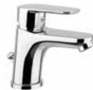
81CR8120 01 Miscelatore lavabo. One hole basin mixer.

3/8" 81 CR 8120 01 = flex 3/8" F 1/2" 81 CR 8120 02 = flex 1/2" F