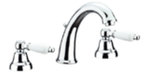
02CR0628 Batteria lavabo 3 fori. 3-hole basin mixer.