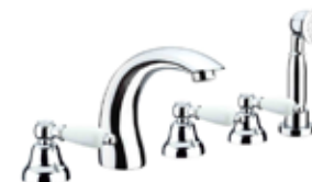
02CR0608 Batteria bordo vasca 5 fori. 5-hole bath mixer.