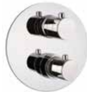
31CR0924 Miscelatore termostatico doccia incasso. Built-in thermostatic shower mixer.