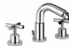
25CR0538 Batteria bidet 3 fori. 3-hole bidet mixer.