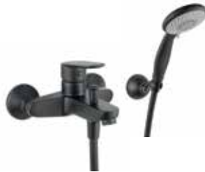
81NN8150 Miscelatore vasca con duplex. Bath mixer with shower set.