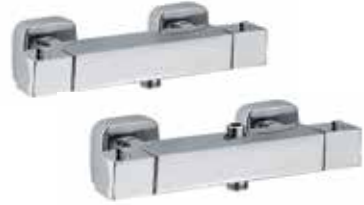
31CR0958 Miscelatore termostatico doccia esterno senza duplex. Thermostatic shower mixer without shower set.