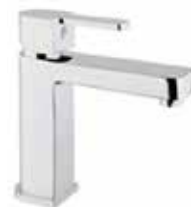
76CR7420 01 Miscelatore lavabo. One hole basin mixer. 3/8" 76 CR 7420 01 = flex 3/8"F 1/2" 76 CR 7420 02 = flex 1/2"F