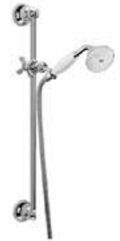
30 0394 05 Set saliscendi 64-18 con doccia Antica imp. ceram. bianca 1g. testa d.7,5 cm flex doppia aggraffatura. Sliding rail set 64-18 with Single jet white ceramic shower Ø 7,5 cm, double seam flexible.