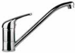
39CR4110 01 Miscelatore lavello. One hole sink mixer. 3/8" 39 CR 4110 01 = flex 3/8"F 1/2" 39 CR 4110 02 = flex 1/2"F