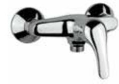
41CR1700 Miscelatore doccia esterno. External shower mixer.