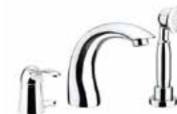
47CR5105 Miscelatore bordo vasca 3 fori. 3-hole bath mixer.