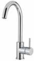
306CR9208 01 Miscelatore lavello. One hole sink mixer. 3/8" 306 CR 9208 01 = flex 3/8"F 1/2" 306 CR 9208 02 = flex 1/2"F