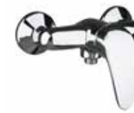
32CR1230 Miscelatore doccia esterno. External shower mixer.