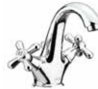
26CR0623 01 Monoforo lavabo. One hole basin mixer. 3/8" 26 CR 0623 01 = flex 3/8"F 1/2" 26 CR 0623 02 = flex 1/2"F