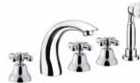
26CR0608 Batteria bordo vasca 5 fori. 5-hole bath mixer.