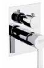
77CR7501 Miscelatore doccia incasso con deviatore, 3 vie. 3-way built-in shower mixer.