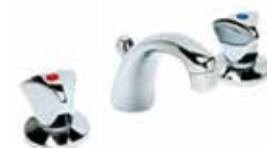
24CR0027 Batteria lavabo 3 fori. 3-hole basin mixer.

3/8" 24 CR 0367 01 = flex 3/8"F 1/2" 24 CR 0367 02 = flex 1/2"F