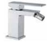
100CR8535 01 Miscelatore bidet. One hole bidet mixer. 3/8" 100 CR 8535 01 = flex 3/8"F 1/2" 100 CR 8535 02 = flex 1/2"F