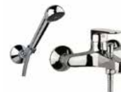
81CR1500 Miscelatore vasca con duplex. Bath mixer with shower set.