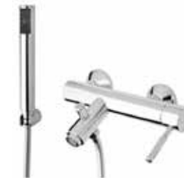
44CR5150 Miscelatore vasca con duplex. Bath mixer with shower set.