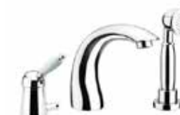
83CR5105 Miscelatore bordo vasca 3 fori. 3-hole bath mixer.