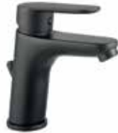
81NN8123 01 Miscelatore lavabo. One hole basin mixer. 3/8" 81 NN 8123 01 = flex 3/8"F 1/2" 81 NN 8123 02 = flex 1/2"F