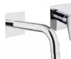
86CR7527 Miscelatore lavabo a muro. Wall basin mixer.