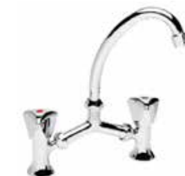
24CR0243 Gruppo lavabo a ponte. Basin mixer, bridge model.