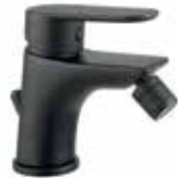
81NN8130 01 Miscelatore bidet. One hole bidet mixer. 3/8" 81 NN 8130 01 = flex 3/8"F 1/2" 81 NN 8130 02 = flex 1/2"F