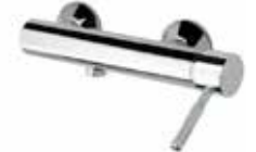
44CR5170 Miscelatore doccia esterno. External shower mixer.