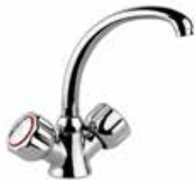
14CR0368 Monoforo lavello. One hole sink mixer. 3/8" 14 CR 0368 01 = flex 3/8"F 1/2" 14 CR 0368 02 = flex 1/2"F