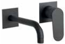
81NN7527 Miscelatore lavabo a muro. Wall basin mixer.