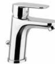
81CR8123 01 Miscelatore lavabo. One hole basin mixer.

3/8" 81 CR 8120 01 = flex 3/8" F 1/2" 81 CR 8120 02 = flex 1/2" F