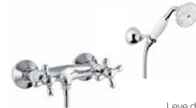
26CR0602 Gruppo doccia esterno. External shower mixer.