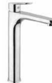
81CR8119 01 Miscelatore lavabo alto. One hole basin mixer, high body.

3/8" 81 CR 8123 01 = flex 3/8" F 1/2" 81 CR 8123 02 = flex 1/2" F