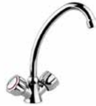
14CR0360 01 Monoforo lavello. One hole sink mixer. 3/8" 14 CR 0360 01 = flex 3/8"F 1/2" 14 CR 0360 02 = flex 1/2"F