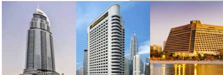
The Address Hotel Dubai UAE