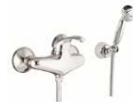
47CR5127 Miscelatore doccia esterno. External shower mixer.