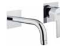
76CR7427 Miscelatore lavabo a muro. Wall basin mixer.