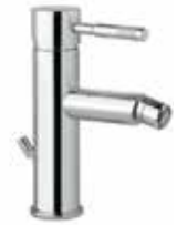
44CR5371 01 Miscelatore bidet. One hole bidet mixer. 3/8 44 CR 5371 01 = flex 3/8"F 1/2 44 CR 5371 02 = flex 1/2"F