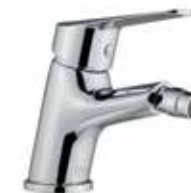
86CR8135 01 Miscelatore bidet. One hole bidet mixer. 3/8" 86 CR 8135 01 = flex 3/8"F 1/2" 86 CR 8135 02 = flex 1/2"F