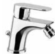
81CR8130 01 Miscelatore bidet. One hole bidet mixer.

3/8" 81 CR 8119 01 = flex 3/8" F 1/2" 81 CR 8119 02 = flex 1/2" F