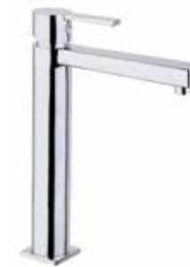
77CR7591 01 Miscelatore lavabo alto. One hole basin mixer, high body. 3/8" 77 CR 7591 01 = flex 3/8"F 1/2" 77 CR 7591 02 = flex 1/2"F