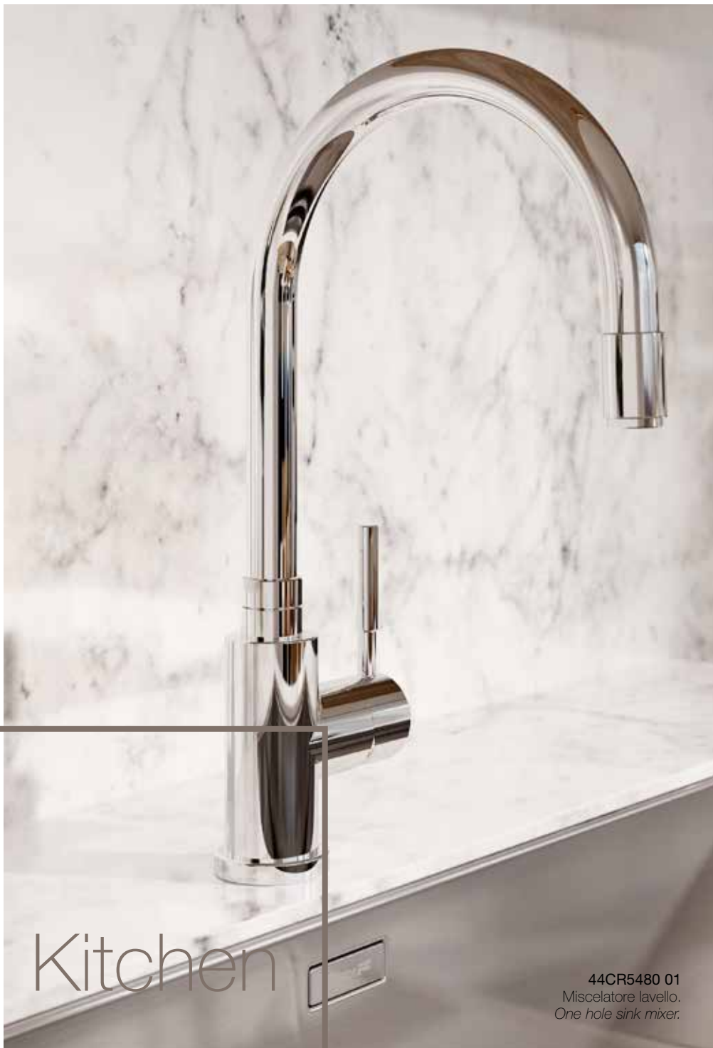
44CR5480 01 Miscelatore lavello. One hole sink mixer.