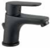
81NN8120 01 Miscelatore lavabo. One hole basin mixer. 3/8" 81 NN 8120 01 = flex 3/8"F 1/2" 81 NN 8120 02 = flex 1/2"F