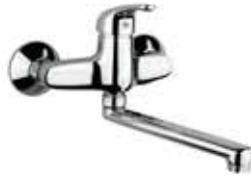
39CR4200 Miscelatore lavello a muro. Wall sink mixer.