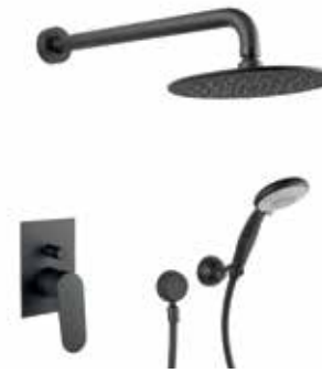
81NN7557 Miscelatore doccia incasso con deviatore, soffione Ø200 mm, presa acqua con duplex 2-way built-in shower mixer, Ø200 mm shower head, intake of water and shower set