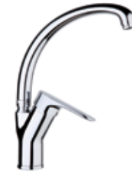
81CR4318 01 Miscelatore lavello. One hole sink mixer. 3/8" 81 CR 4318 01 = flex 3/8"F 1/2" 81 CR 4318 02 = flex 1/2"F