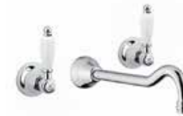
02CR0636 Miscelatore lavabo a muro. Wall basin mixer.