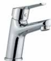
86CR8110 01 Miscelatore lavabo. One hole basin mixer. 3/8" 86 CR 8110 01 = flex 3/8"F 1/2" 86 CR 8110 02 = flex 1/2"F