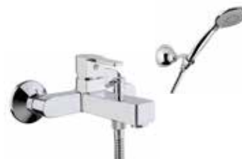
76CR7450 Miscelatore vasca con duplex. Bath mixer with shower set.