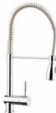
44CR5465 01 Miscelatore lavello industriale. Professional sink mixer. 3/8" 44 CR 5465 01 = flex 3/8"F 1/2" 44 CR 5465 02 = flex 1/2"F