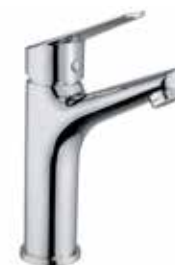
86CR8112 01 Miscelatore lavabo. One hole basin mixer. 3/8" 86 CR 8112 01 = flex 3/8"F 1/2" 86 CR 8112 02 = flex 1/2"F