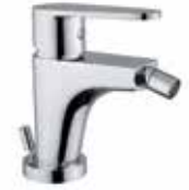
88CR5535 01 Miscelatore bidet. One hole bidet mixer. 3/8" 88 CR 5535 01 = flex 3/8"F 1/2" 88 CR 5535 02 = flex 1/2"F