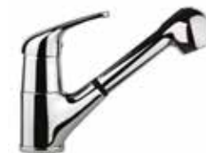
39CR4010 01 Miscelatore lavello, doccetta estraibile. One hole sink mixer, pull-out shower. 3/8" 39 CR 4010 01 = flex 3/8"F 1/2" 39 CR 4010 02 = flex 1/2"F