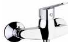
86CR6511 Miscelatore doccia esterno. External shower mixer.