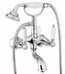
02CR0600 Gruppo vasca. Bath mixer.