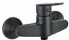
81NN6511 Miscelatore doccia esterno. External shower mixer.