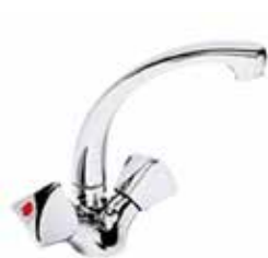
24CR0369 01 Miscelatore lavabo. One hole basin mixer.

3/8" 24 CR 0369 01 = flex 3/8"F 1/2" 24 CR 0369 02 = flex 1/2"F