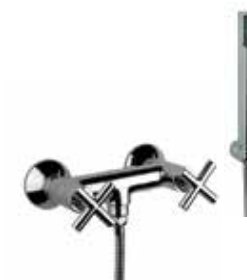
25CR0512 Miscelatore doccia esterno. External shower mixer.