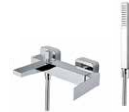
100CR8552 Miscelatore vasca con duplex. Bath mixer with shower set.