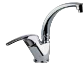
32CR2243 01 Miscelatore lavabo. One hole basin mixer.

\frac{3}{8} 32 CR 2210 01 = flex 3/8" F \frac{1}{2} 32 CR 2210 02 = flex 1/2" F