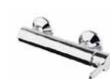
77CR7575 Miscelatore doccia esterno. External shower mixer.