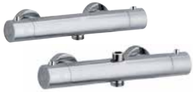
31CR0956 Miscelatore termostatico doccia esterno senza duplex. Thermostatic shower mixer without shower set.