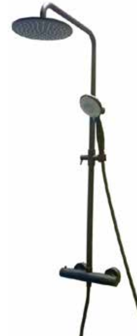
44NN0932 Miscelatore termostatico per doccia esterno, versione completa di colonna telescopica, soffione e doccetta idromassaggio. Thermostatic shower mixer with telescopic column, shower head and massage handshower.