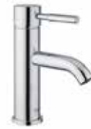
44CR5283 01 Miscelatore lavabo. One hole basin mixer. 3/8 44 CR 5283 01 = flex 3/8"F 1/2 44 CR 5283 02 = flex 1/2"F