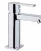
77CR7530 01 Miscelatore bidet. One hole bidet mixer. 3/8" 77 CR 7530 01 = flex 3/8"F 1/2" 77 CR 7530 02 = flex 1/2"F