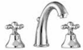
26CR0628 Batteria lavabo 3 fori. 3-hole basin mixer.