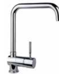
44CR5461 01 Miscelatore lavello. One hole sink mixer. 3/8" 44 CR 5461 01 = flex 3/8"F 1/2" 44 CR 5461 02 = flex 1/2"F