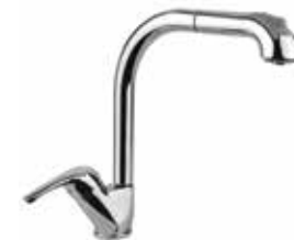
39CR4399 01 Miscelatore lavello, doccetta estraibile. One hole sink mixer, pull-out shower. 3/8" 39 CR 4399 01 = flex 3/8"F 1/2" 39 CR 4399 02 = flex 1/2"F