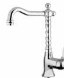
83CR5225 01 Miscelatore lavabo. One hole basin mixer. 3/8" 83 CR 5225 01 = flex 3/8"F 1/2" 83 CR 5225 02 = flex 1/2"F