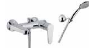
88CR5550 Miscelatore vasca con duplex. Bath mixer with shower set.