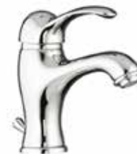
47CR5221 01 Miscelatore lavabo. One hole basin mixer. 3/8" 47 CR 5221 01 = flex 3/8"F 1/2" 47 CR 5221 02 = flex 1/2"F