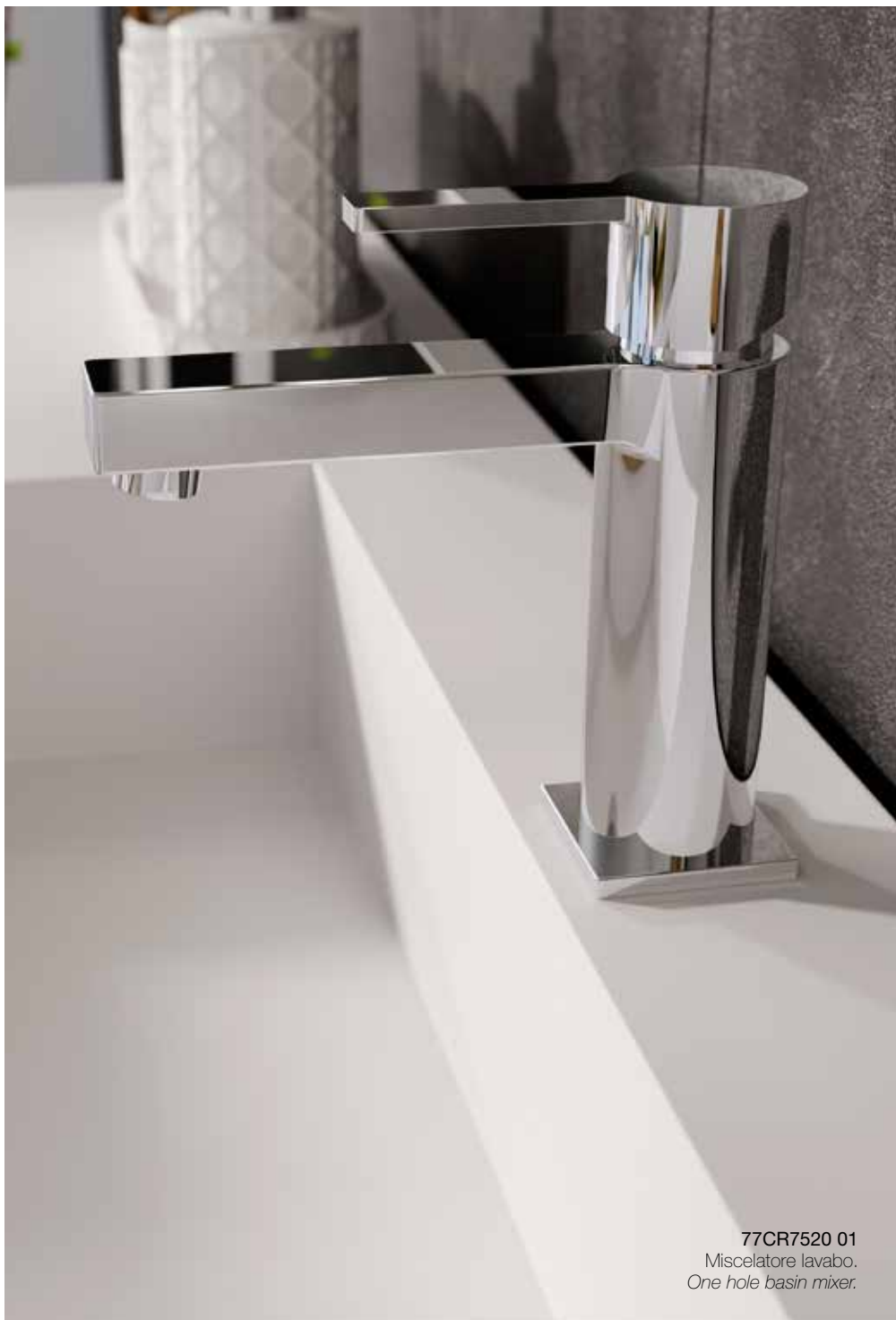
77CR7520 01 Miscelatore lavabo. One hole basin mixer.