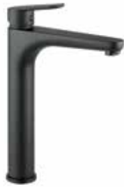
81NN8119 01 Miscelatore lavabo alto. One hole basin mixer, high body. 3/8" 81 NN 8119 01 = flex 3/8"F 1/2" 81 NN 8119 02 = flex 1/2"F