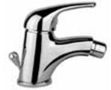
41CR3710 01 Miscelatore bidet. One hole bidet mixer. 3/8" 41 CR 3710 01 = flex 3/8"F 1/2" 41 CR 3710 02 = flex 1/2"F