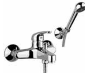
41CR1500 Miscelatore vasca con duplex. Bath mixer with shower set.