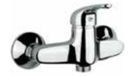
41CR1720 Miscelatore doccia esterno. External shower mixer.