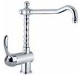
47CR5415 01 Miscelatore lavello. One hole sink mixer. 3/8" 47 CR 5415 01 = flex 3/8"F 1/2" 47 CR 5415 02 = flex 1/2"F