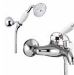
83CR5104 Miscelatore vasca con duplex. Bath mixer with shower set.