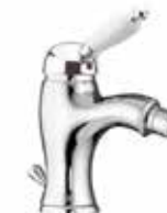
83CR5321 01 Miscelatore bidet. One hole bidet mixer. 3/8" 83 CR 5321 01 = flex 3/8"F 1/2" 83 CR 5321 02 = flex 1/2"F