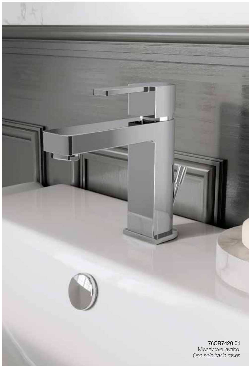
76CR7420 01 Miscelatore lavabo. One hole basin mixer.