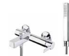
77CR7550 Miscelatore vasca con duplex. Bath mixer with shower set.