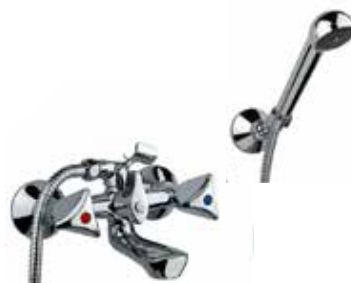
24CRF212 Gruppo vasca con duplex. Bath mixer with shower set.