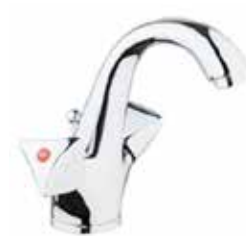
24CR0623 01 Miscelatore lavabo. One hole basin mixer.

3/8" 24 CR 0369 01 = flex 3/8"F 1/2" 24 CR 0369 02 = flex 1/2"F