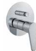
88CR7506 Miscelatore doccia incasso con deviatore, 2 vie. 2-way built-in shower mixer.