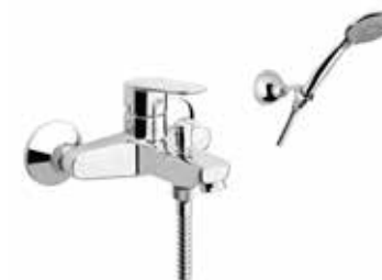
81CR8150 Miscelatore vasca con duplex. Bath mixer with shower set.

3/8" 81 CR 8130 01 = flex 3/8" F 1/2" 81 CR 8130 02 = flex 1/2" F