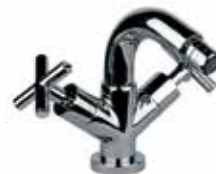
25CR0532 01 Miscelatore bidet. One hole bidet mixer. 3/8" 25 CR 0532 01 = flex 3/8"F 1/2" 25 CR 0532 02 = flex 1/2"F