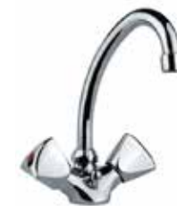
24CR0367 01 Miscelatore lavabo. One hole basin mixer.

3/8" 24 CR 0623 01 = flex 3/8"F 1/2" 24 CR 0623 02 = flex 1/2"F