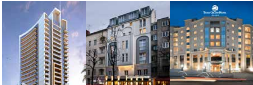
Burj Damac Waterfront Doha Qatar