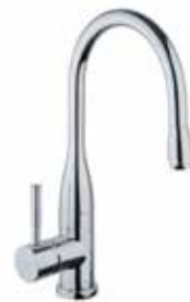
44CR5455 01 Miscelatore lavello. One hole sink mixer. 3/8" 44 CR 5455 01 = flex 3/8"F 1/2" 44 CR 5455 02 = flex 1/2"F