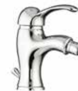
47CR5321 01 Miscelatore bidet. One hole bidet mixer. 3/8" 47 CR 5321 01 = flex 3/8"F 1/2" 47 CR 5321 02 = flex 1/2"F