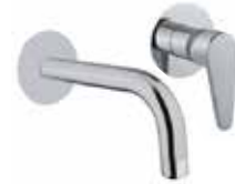
88CR7547 Miscelatore lavabo a muro. Wall basin mixer.