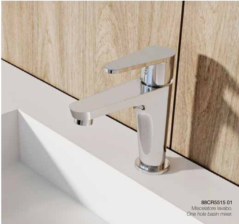
88CR5515 01 Miscelatore lavabo. One hole basin mixer.