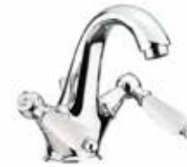
02CR0623 01 Monoforo lavabo. One hole basin mixer. 3/8" 02 CR 0623 01 = flex 3/8"F 1/2" 02 CR 0623 02 = flex 1/2"F