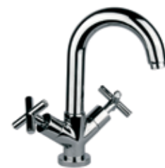
25CR0522 01 Miscelatore lavabo. One hole basin mixer. 3/8" 25 CR 0522 01 = flex 3/8"F 1/2" 25 CR 0522 02 = flex 1/2"F