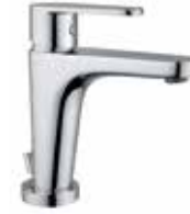
88CR5515 01 Miscelatore lavabo. One hole basin mixer. 3/8" 88 CR 5515 01 = flex 3/8"F 1/2" 88 CR 5515 02 = flex 1/2"F