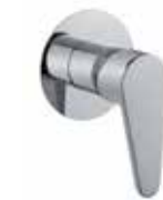
88CR7565 Miscelatore doccia incasso. Built-in shower mixer.