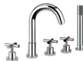
25CR0505 Bordo vasca 5 fori. 5-hole bath mixer.