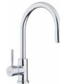
44CR5480 01 Miscelatore lavello. One hole sink mixer. 3/8" 44 CR 5480 01 = flex 3/8"F 1/2" 44 CR 5480 02 = flex 1/2"F