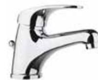
32CR2210 01 Miscelatore lavabo. One hole basin mixer.

\frac{3}{8} 32 CR 2210 01 = flex 3/8" F \frac{1}{2} 32 CR 2210 02 = flex 1/2" F