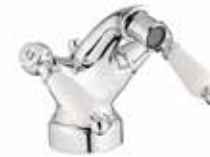
02CR0632 01 Monoforo bidet. One hole bidet mixer. 3/8" 02 CR 0632 01 = flex 3/8"F 1/2" 02 CR 0632 02 = flex 1/2"F