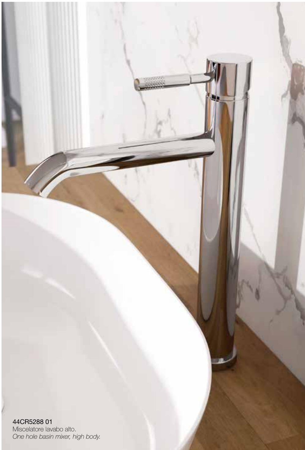
44CR5288 01 Miscelatore lavabo alto. One hole basin mixer, high body.