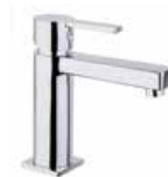
77CR7520 01 Miscelatore lavabo. One hole basin mixer. 3/8" 77 CR 7520 01 = flex 3/8"F 1/2" 77 CR 7520 02 = flex 1/2"F