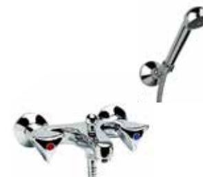
24CR0201 Gruppo vasca con duplex. Bath mixer with shower set.