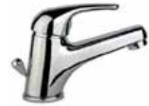
41CR2710 01 Miscelatore lavabo. One hole basin mixer. 3/8" 41 CR 2710 01 = flex 3/8"F 1/2" 41 CR 2710 02 = flex 1/2"F