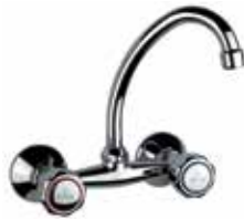
14CR0221 Gruppo lavello a muro. Wall sink mixer.