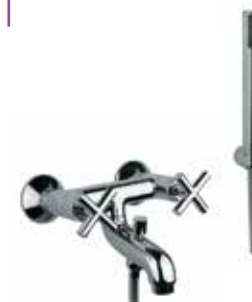
25CR0510 Miscelatore vasca con duplex. Bath mixer with shower set.