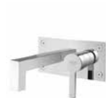
77CR7724 Miscelatore lavabo a muro. Wall basin mixer.