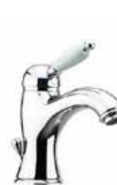
83CR5221 01 Miscelatore lavabo. One hole basin mixer. 3/8" 83 CR 5221 01 = flex 3/8"F 1/2" 83 CR 5221 02 = flex 1/2"F