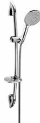
30 0397 05 Set saliscendi 86-25 con doccia Cascata 5g. testa d.16 cm flex doppia aggraffatura e portasapone cromato. Sliding rail set 86-25 with Waterfall 5-jet shower Ø 16 cm, double seam flexible and chrome soap dish.