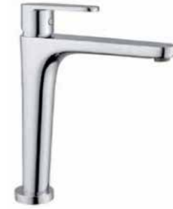
88CR5514 01 Miscelatore lavabo alto. One hole basin mixer, high body. 3/8" 88 CR 5514 01 = flex 3/8"F 1/2" 88 CR 5514 02 = flex 1/2"F