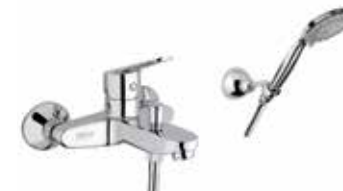
86CR8151 Miscelatore vasca con duplex. Bath mixer with shower set.