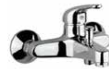
41CR1510 Miscelatore vasca senza duplex. Bath mixer without shower set.