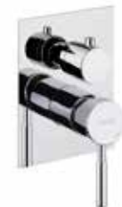
44CR7501 Miscelatore doccia incasso con deviatore, 3 vie. 3-way built-in shower mixer.